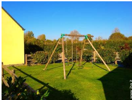
Attrezzature esterne a disposizione degli ospiti