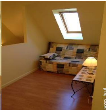
divano(i) letto 2 pers