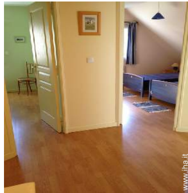
Comfort interno a disposizione degli ospiti