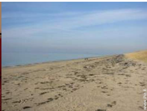
luogo per bagnarsi