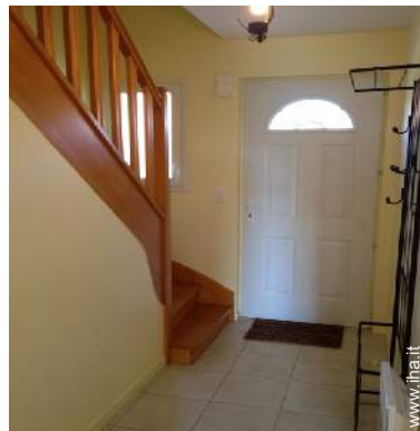
Comfort interno a disposizione degli ospiti