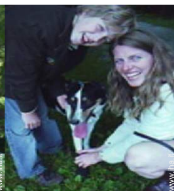
I vostri ospiti