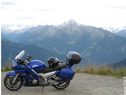
sport motorizzati nelle vicinanze