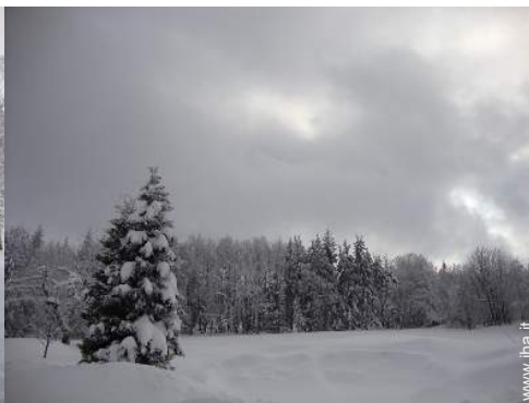
vista sulla foresta