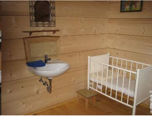
letto (i) bambino