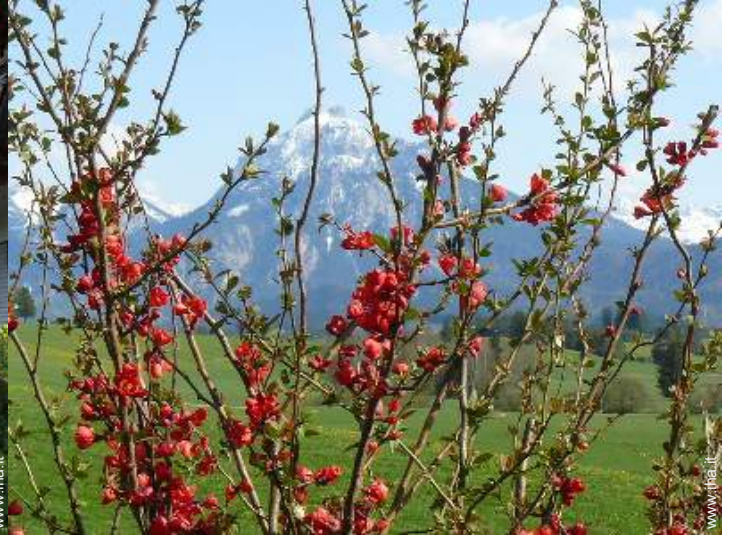
vista sulla montagna