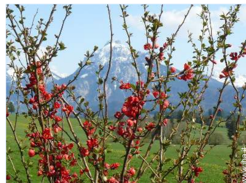
vista sulla montagna

Barbecue, tavolo da giardino, sedia(e) da giardino, ombrellone, 6 sedia sdraio, 1 amaca(che), altalena, struttura rampicante per bambini, vasca per la sabbia