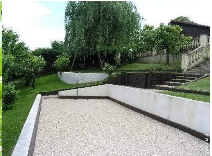
gioco delle bocce