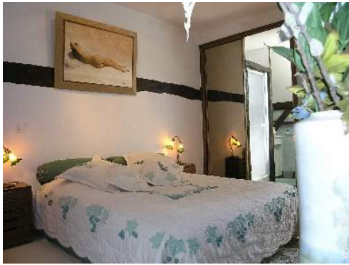
camera del proprietario