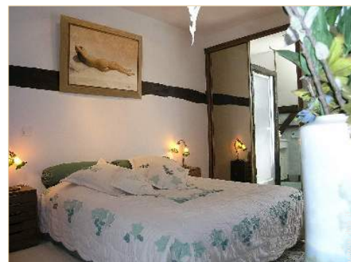
camera del proprietario

Cucina esterna, salotto estivo, bar esterno, forno per pizze, barbecue, ombrellone, salotto da giardino, 8 sedia sdraio, altalena, doccia esterna