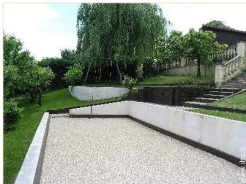
gioco delle bocce