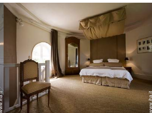
letto(i) matrimoniale(i) a baldacchino