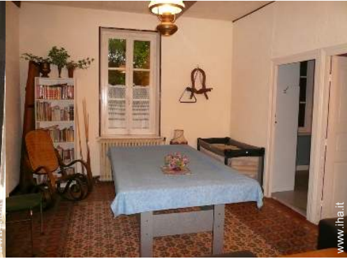
tavolo da biliardo