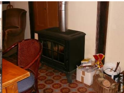
stufa a legna