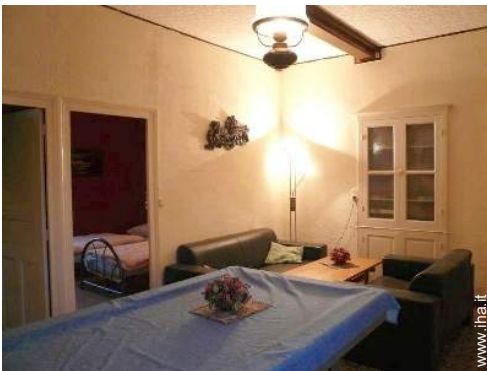
tavolo da biliardo