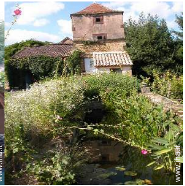
piscina fuori terra