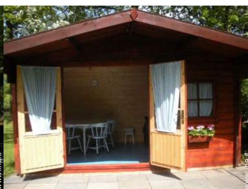
Attrezzature a disposizione