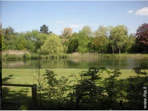
vista sul lago