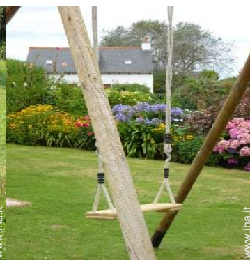
struttura rampicante per bambini