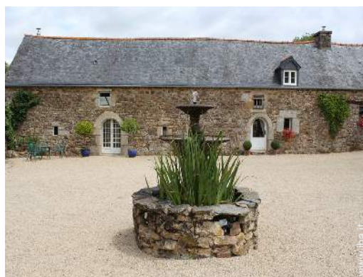
Dimora in Pietra di Charme