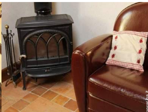
stufa a legna