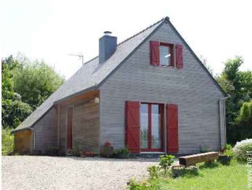
Casa in legno