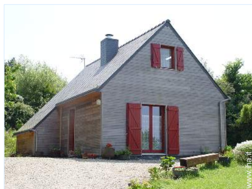
Casa in legno