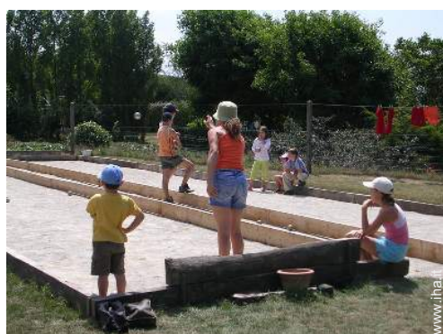
gioco delle bocce