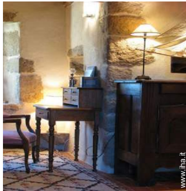
sala di musica