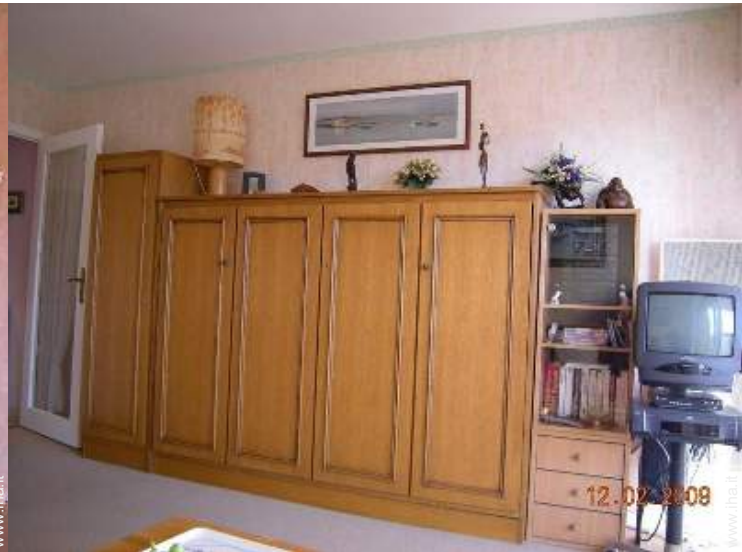
letto(i) a scomparsa 2 pers