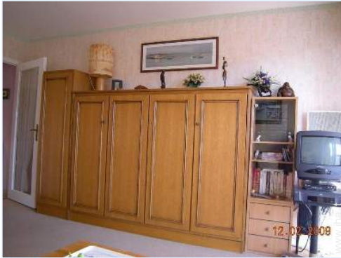
letto(i) a scomparsa 2 pers