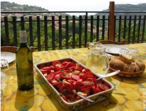
preparazione pasti tipici