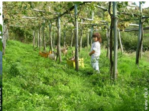
vista sui campi agricoli