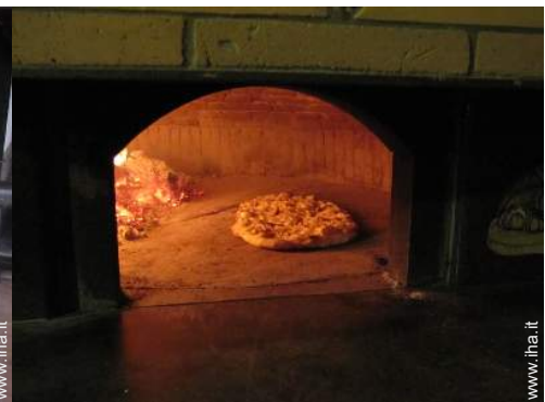
preparazione pasti tipici