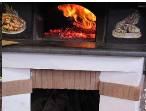
forno per pizze