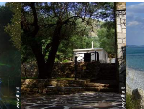
Attrezzature esterne a disposizione degli ospiti