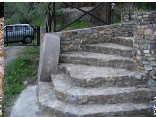
Ambito esterno a disposizione degli ospiti