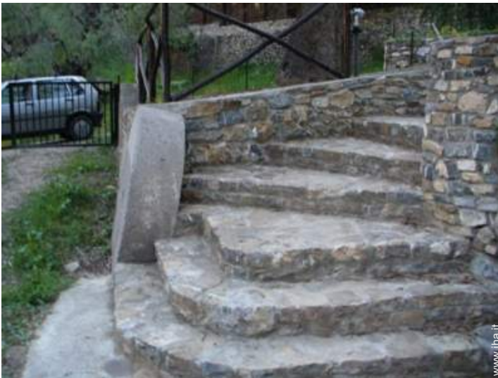
Ambito esterno a disposizione degli ospiti