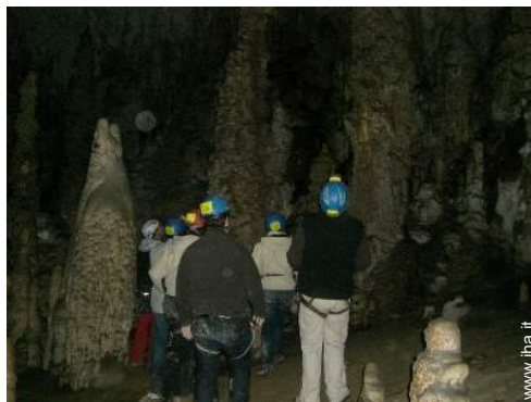
arrampicata su roccia