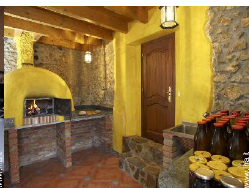
forno per pizze