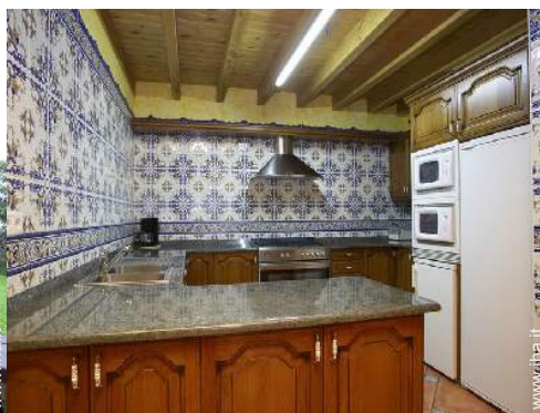
grande cucina in stile americano