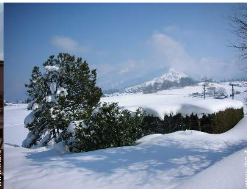
sport invernali nelle vicinanze