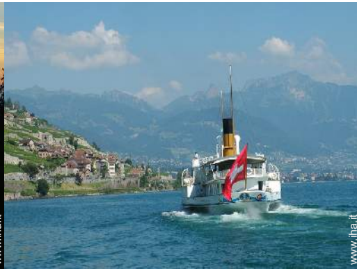
sport estivi nelle vicinanze