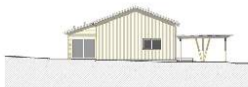
FACADE NORD OVEST