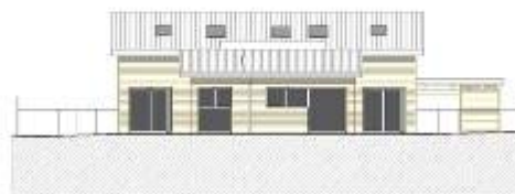
FACADE SUD EST