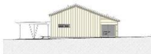
FACADE SUD OVEST