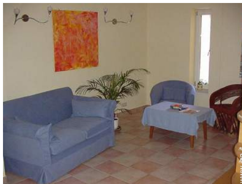
collezione di libri