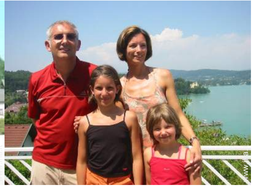
I vostri ospiti