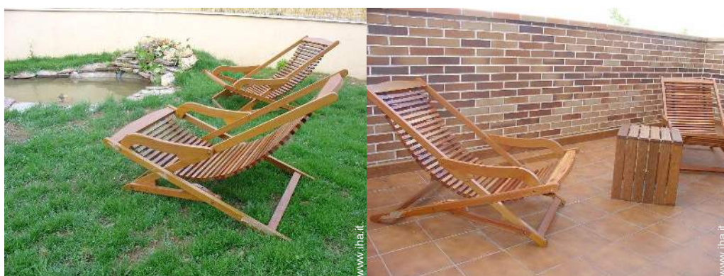
sedia(e) da giardino