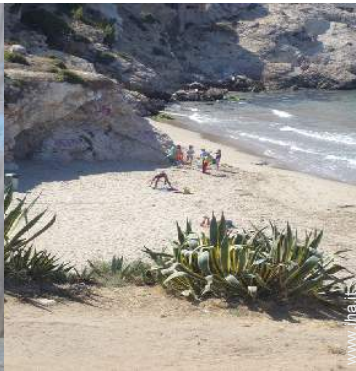
spiaggia dei nudisti