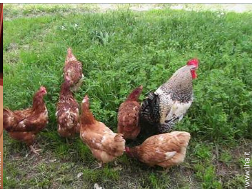
Gli animali domestici