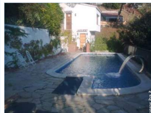
Piscina con acqua di mare