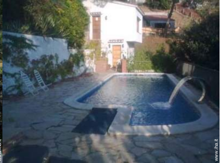
Piscina con acqua di mare