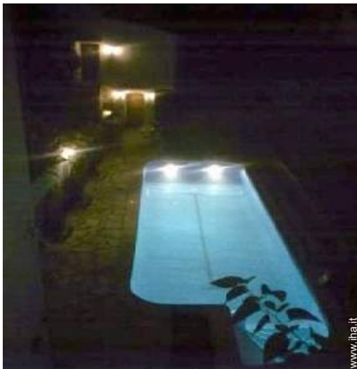
sistema di illuminazione