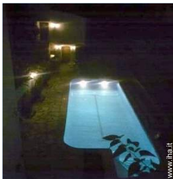
sistema di illuminazione