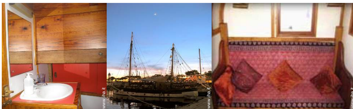
Sistemazione interna a disposizione degli ospiti