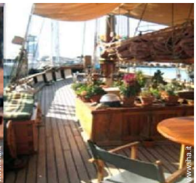
Ambito esterno a disposizione degli ospiti