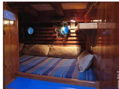
La camera degli ospiti