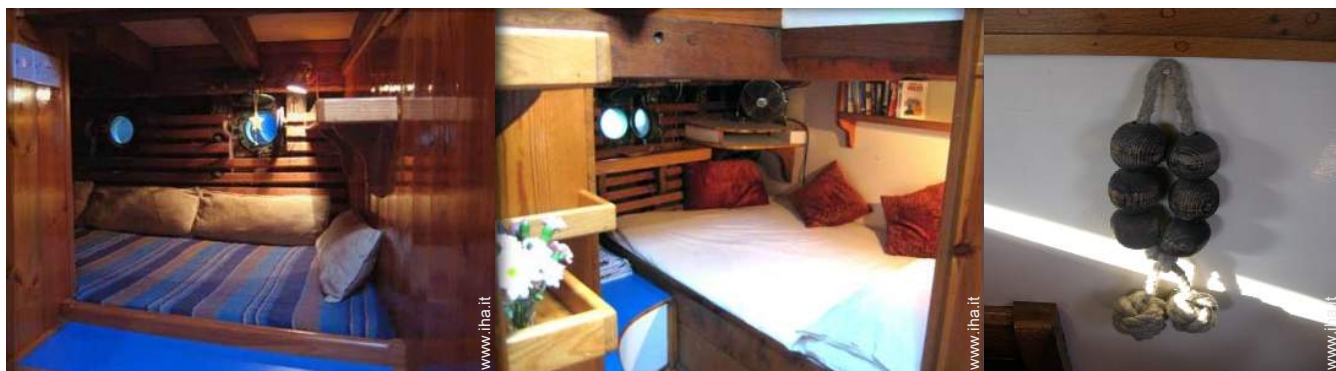
La camera degli ospiti