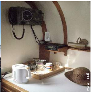
Comfort interno a disposizione degli ospiti