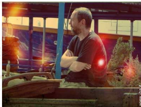
Il vostro ospite