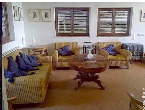
Sistemazione interna a disposizione degli ospiti