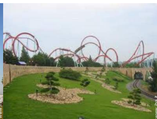
parco dei divertimenti