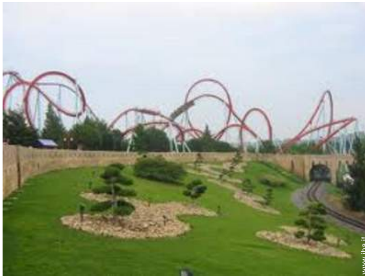
parco dei divertimenti