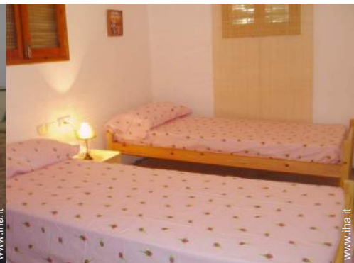
letti gemelli singoli