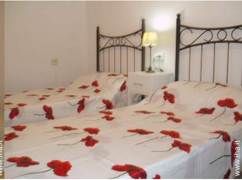
letti gemelli singoli