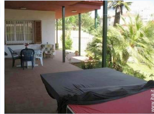
sedia(e) da giardino