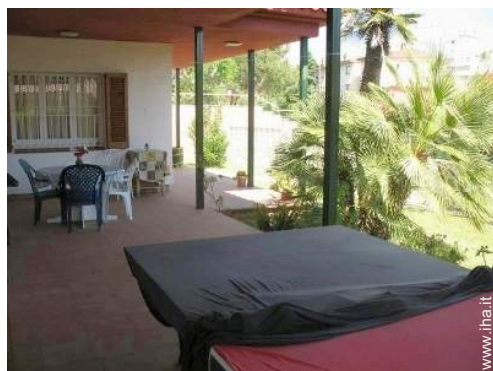
sedia(e) da giardino