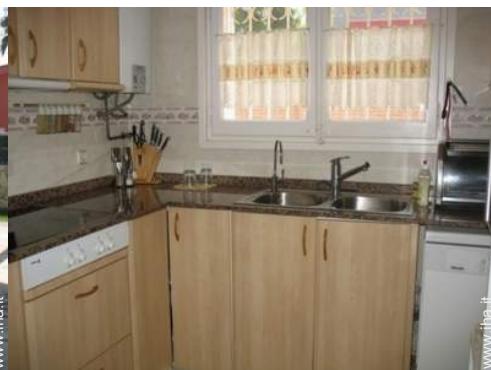
piastra di cottura elettrica