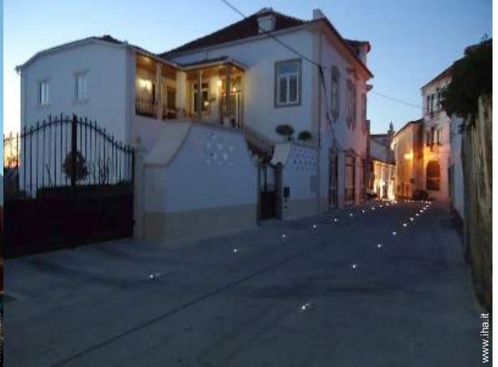
vista sulla strada/viale