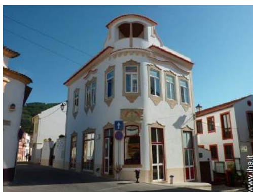
vista sulla strada/viale