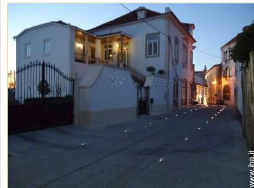
vista sulla strada/viale