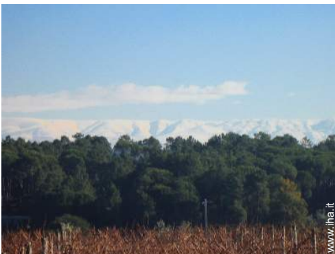
piste di sci