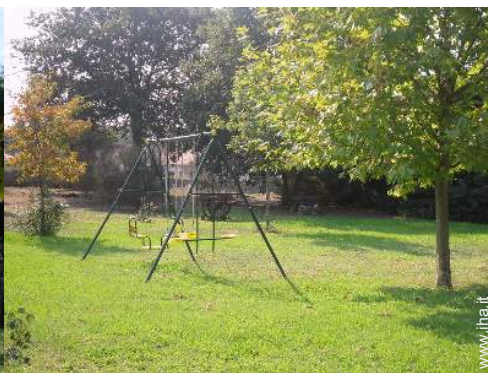
struttura rampicante per bambini