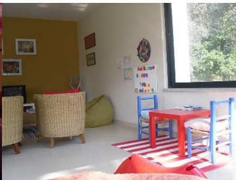
salotto da giardino