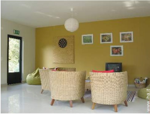
gioco delle freccette