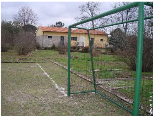
Attrezzature esterne a disposizione degli ospiti