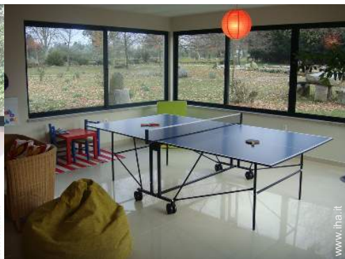
tavolo da ping-pong