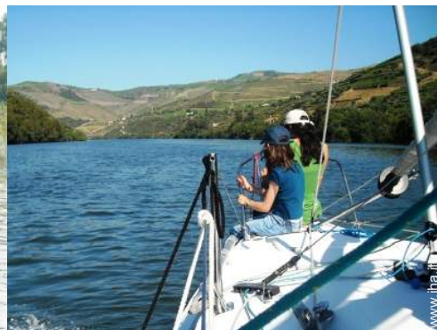
escursione in barca