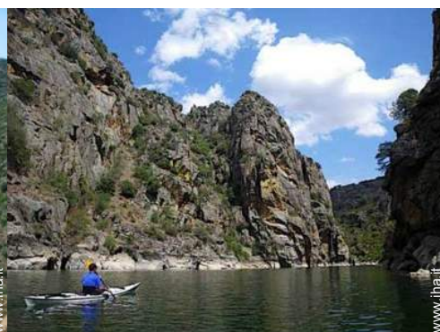
barca a remi