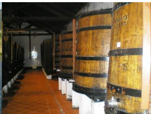
cantina e degustazione di vino