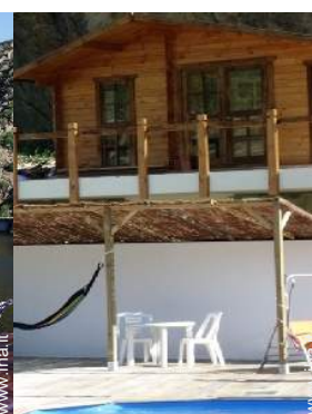
tavolo da giardino