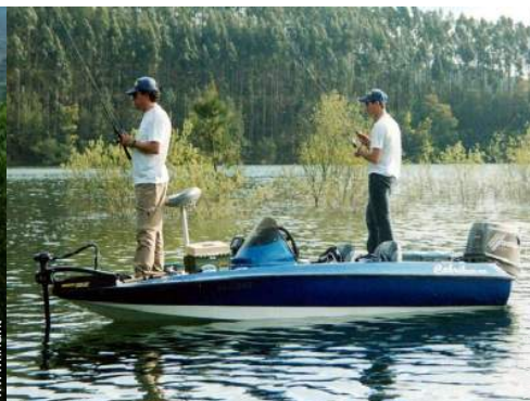
pesca con lenza