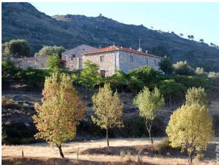
Casa di Campagna