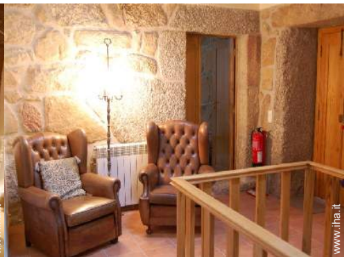
Comfort interno a disposizione degli ospiti