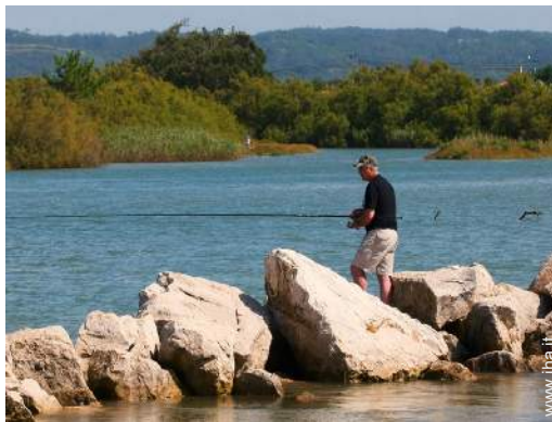
pesca con lenza