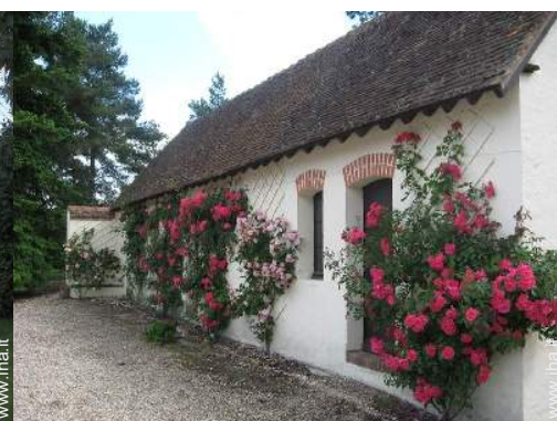
vista sul cortile