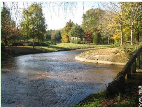
vista sul fiume