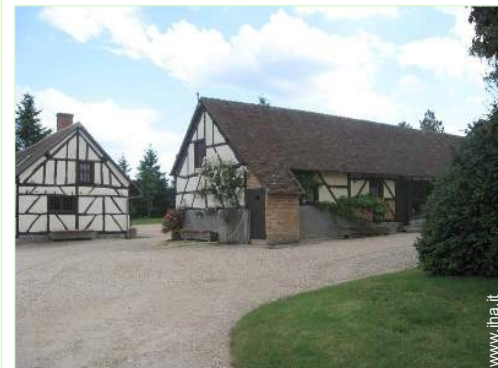
vista sul cortile