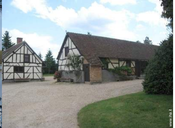
vista sul cortile