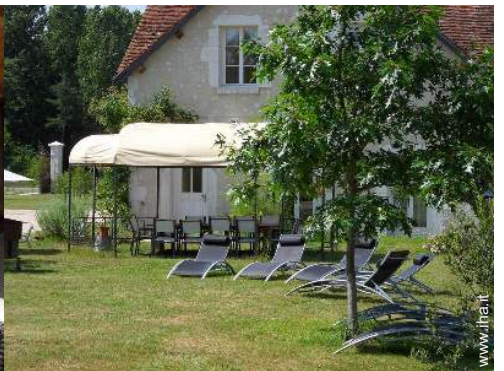
salotto da giardino