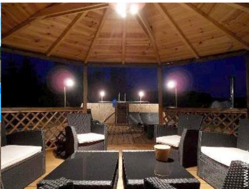
salotto da giardino