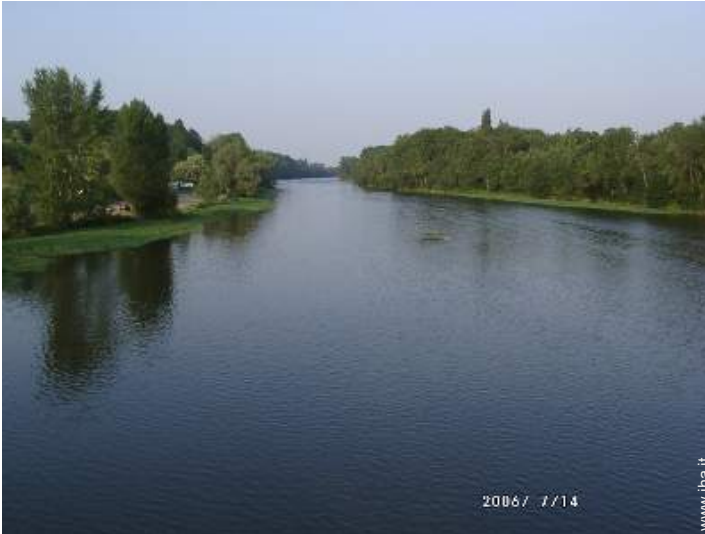
pesca con lenza