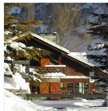
Chalet di Montagna