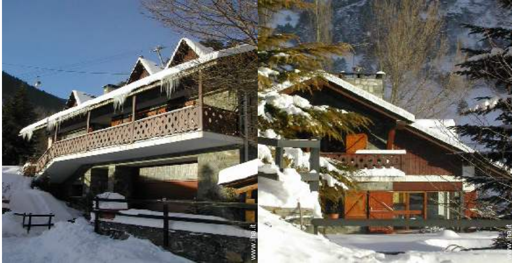
Chalet di Montagna