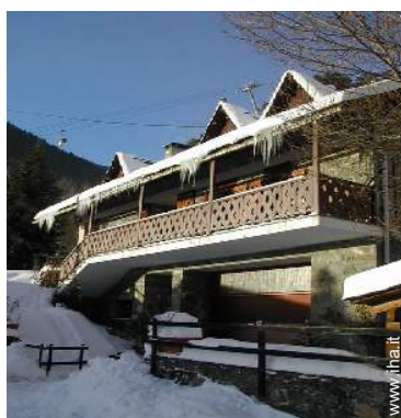
Chalet di Montagna