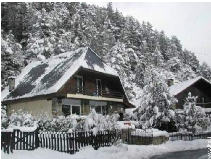
Chalet di Montagna