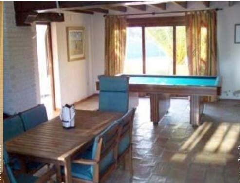
tavolo da biliardo