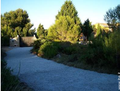
vista sulla foresta