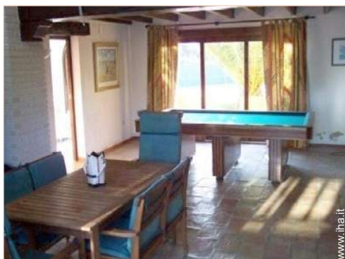
tavolo da biliardo