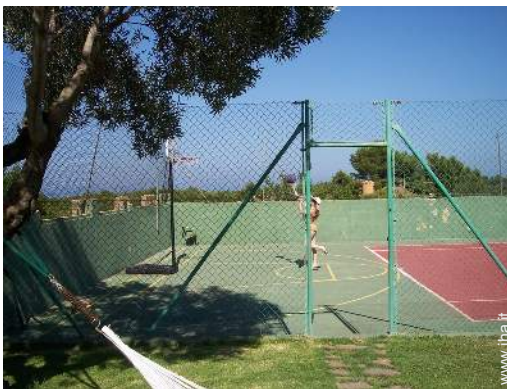
Attrezzature esterne a disposizione degli ospiti