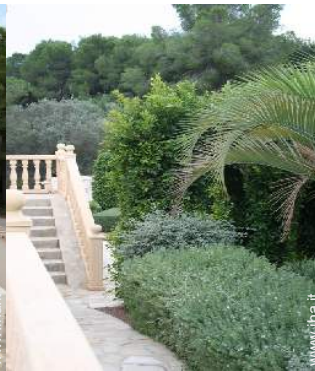
Accoglienza persone diversamente abili