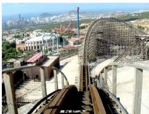
parco dei divertimenti