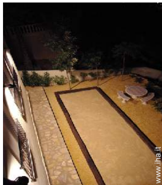
campo di bocce