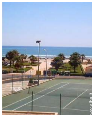
campo da tennis in comune