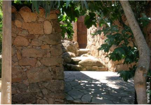
Casa in Pietra di Charme